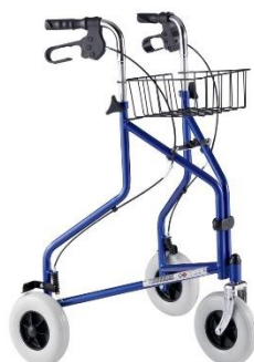
Chodítko DELTA B