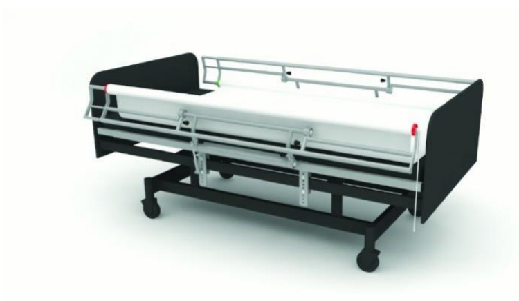
Polohovacia posteľ SYSTEM TURNAID