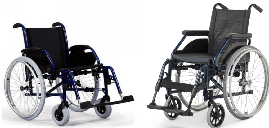
Mechanický invalidný vozík ARDEA, Eurochair Vario