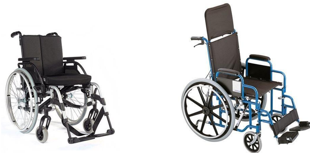
Mechanický invalidný vozík Breezy Rubix