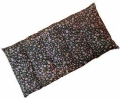
Antidekubitárna podložka s mikroguličkami