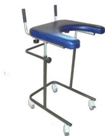
Chodítko s opornou plochou